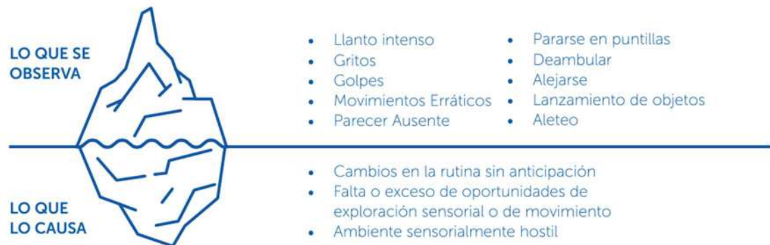
Figura 2: Orientaciones técnicas para la atención de situaciones desafiantes con niños y niñas en el espectro autista en establecimientos de educación parvularia, MINEDUC 2023, página 13

La forma gráfica de describir lo que subyace ante una “situación desafiante”, se puede emplear la figura de un iceberg, que representa la siguiente idea: