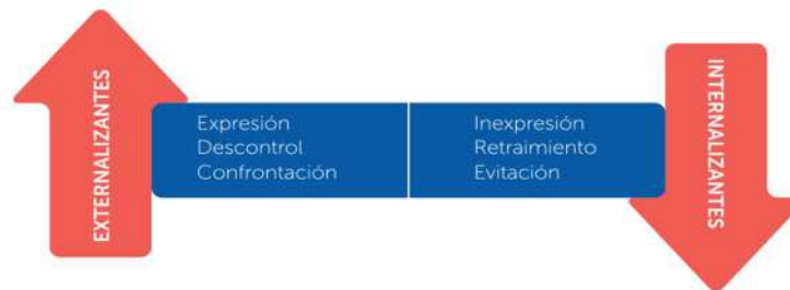
Figura 1: Orientaciones técnicas para la atención de situaciones desafiantes con niños y niñas en el espectro autista en establecimientos de educación parvularia, MINEDUC 2023, página 13

Adicionalmente, es importante tener en cuenta que existen emociones o conductas que, para este caso, pueden entenderse en dos grupos: